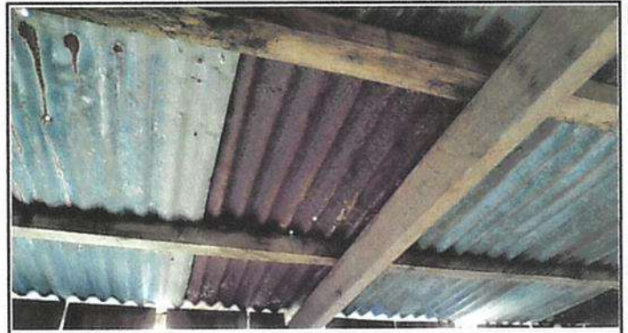
Foto 4: La estructura y la cubierta de lámina ya no ofrecen la protección necesaria para una cocina de un establecimiento educativo