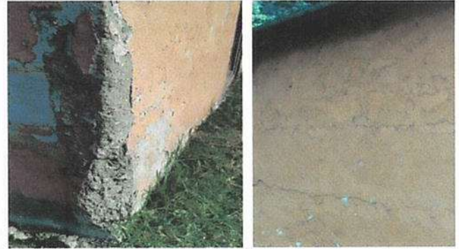
Foto 2: Las columnas y fundiciones han sido fuertemente afectadas por el salitres a ha corroído el concreto y el hierro de la armadura.