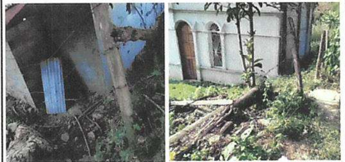
Foto 6: Solo se encuentran vestigios del cerco que existió, siendo necesaria la circulación con malla para proteger la escuela

Observación: Si es necesario se pueden agregar hojas adicionales y actualizar el número de hojas.